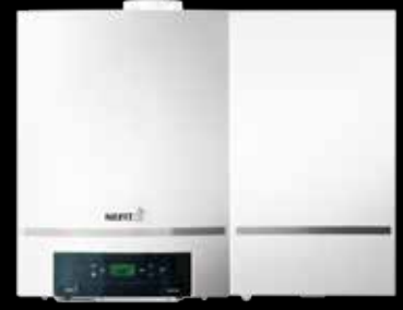
Nefit TopLine AquaPower Plus