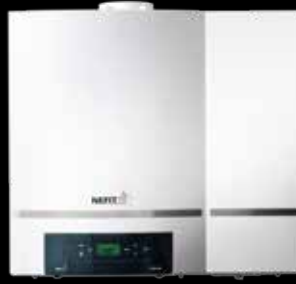
Nefit TopLine AquaPower